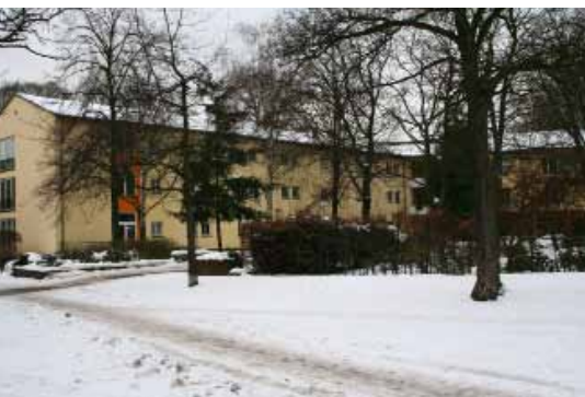
Das WPZ im Winter

Das Wohnpflegezentrum am Jüdischen Krankenhaus im Wedding wird momentan umfangreich modernisiert. Der Zustand der Einrichtung war nicht mehr auf dem Stand der Zeit, inzwischen sieht man in