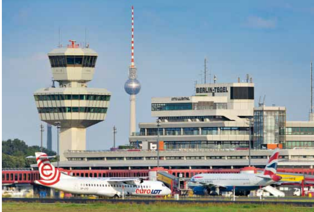
Noch ist der Flughafen Tegel das Tor nach Berlin

ropas begonnen. Am 5. November 1948 landete schließlich eine amerikanische Douglas C-54 als erste Maschine auf der über 2.400 Meter langen Rollbahn. Die Länge der Bahn war dann auch mitentscheidend für die spätere Übertragung des zivilen Nutzungsrechts auf Tegel. Für die neu aufkommenden Düsenjets der Transatlantikflüge war die Piste in Berlin-Tempelhof einfach zu kurz.