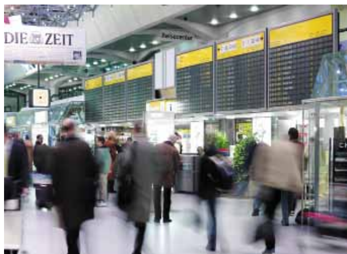
Terminal Tegel ständig in Bewegung

Wer die Tragweite dieser Bestimmung begreifen möchte, muss wissen, dass der Flughafen Tegel für die Berliner Bevölkerung während der Mitte des 20. Jahrhunderts eine Herzensangelegenheit war. Tausende Berliner Männer und Frauen waren in Zeiten höchster Not (Berlin-Blockade 1948/49) an seinem Bau beteiligt gewesen, und das prägte das Verhältnis nachhaltig. Nach der Verhängung der totalen Blockade über West-Berlin durch die sowjetrussische Regierung im Juni 1948 startete General Lucius Clay, der Amerikanische Militär-Gouverneur in Deutschland, das „Unternehmen Luftbrücke“. Dabei konnten die Amerikaner den Flughafen Tempelhof und die Briten den Flughafen Gatow nutzen. Nur Frankreich, als dritte alliierte Besatzungsmacht West-Berlins, hatte keinen eigenen Flughafen, wollte sich aber unter allen Umständen an der humanitären Hilfsaktion beteiligen. In nur 90 Tagen richteten die Franzosen des-