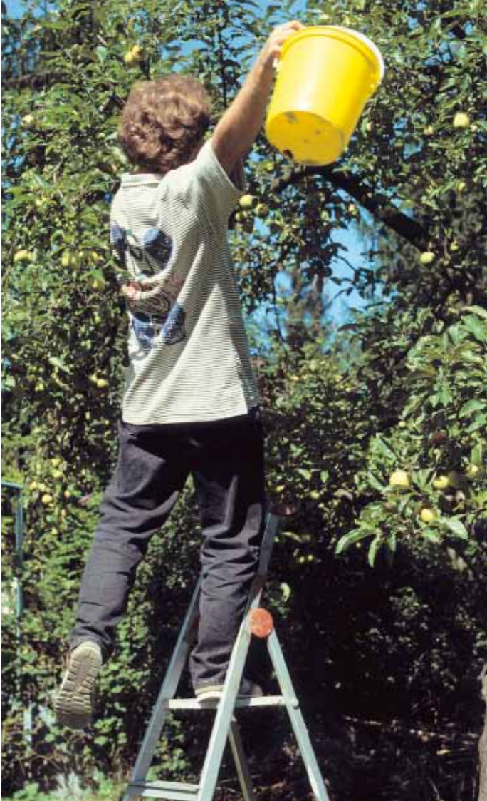
Nicht nur bei der Obsternte, vorsicht auf Leitern

und die entsprechenden Gütesiegel geachtet werden. Auch durch die richtige Stellung der Möbel können Gefahren verringert werden. Möbel stellen oftmals, häufig auch unbeabsichtigt, eine ernstzunehmende Gefahr dar. Durch wenige Handgriffe oder Veränderungen kann man die Gefahr, die von ihnen ausgeht, bannen. Wichtig ist, darauf zu achten, dass die Durchgänge in alle Räume frei sind. Auch sollten Stühle und das Bett die richtige Höhe haben, um gefahrlos aufstehen und sich hinsetzen zu können. Armlehnen oder ein elektrisch verstellbarer Lattenrost sind oft eine geeignete Hilfe, um ein selbständiges Aufstehen und Hinsetzen zu erleichtern. Möbel und Heizkörper können oftmals scharfe Kanten haben, die im Falle eines Sturzes zu Verletzungen führen können.