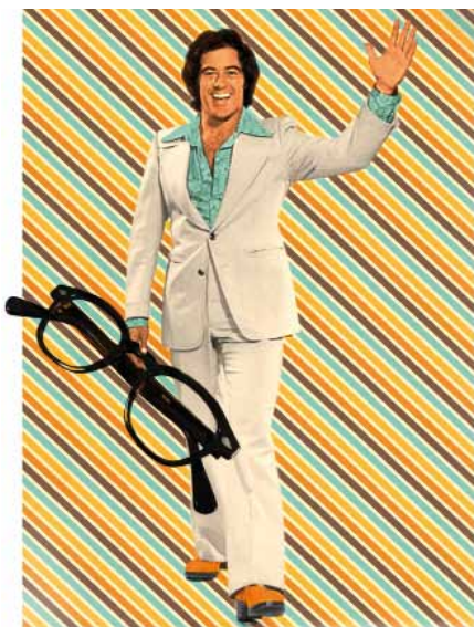
Retro-Motiv für Brillenspenden

Unter dem Slogan „Bring Deine Alte zurück“ sammeln Optiker bun-