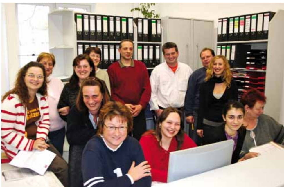
Der Innendienst der Sozialstation Biedermann

Hilfe kann über die Pflegeversicherung beantragt werden. Beratung und Unterstützung bietet hier der ambulante Pflegedienst, etwa auch bei der Antragstellung