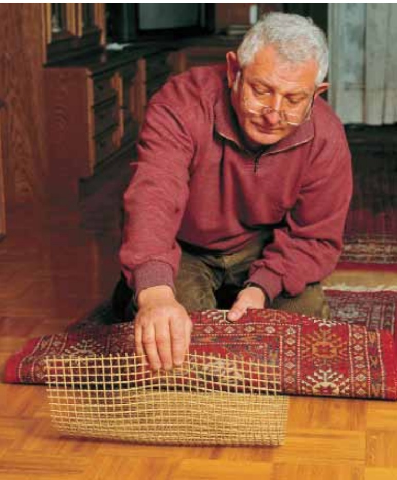
Verhindert das Rutschen des Teppichs - eine Gummimatte

Stolpern, Straucheln, Stürzen - und was man dagegen tun kann. Vor allem bei älteren Menschen ist das nicht nur ein gesundheitliches, sondern auch ein finanzielles Thema. Kein Wunder, dass also die Sturzprophylaxe zu den Expertenstandards der Pflege gehört. Für alle Beteiligten ist es besser, Stürze bereits im Vorfeld zu verhindern. Auszuschließen sind sie sicher nicht, aber das Risiko kann bereits durch einen geschulten Blick, etwa in den eigenen vier Wänden stark vermindert werden. Das Stichwort ist Sturzvermeidung.