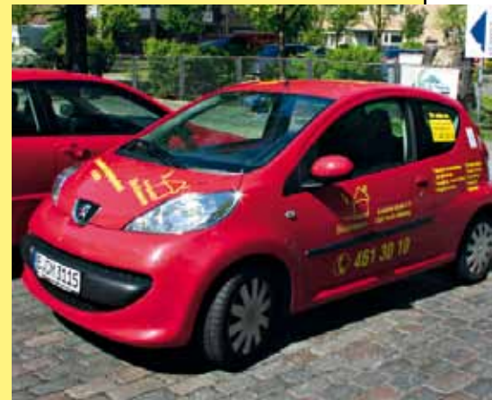
Mobile Sozialstation

Deutliches Zeichen der Sozialstation Biedermann im Wedding, Tiergarten, Reinickendorf und den weiteren Bezirken, in denen unsere Mitarbeiter unterwegs sind, sind die gelben und roten Autos.