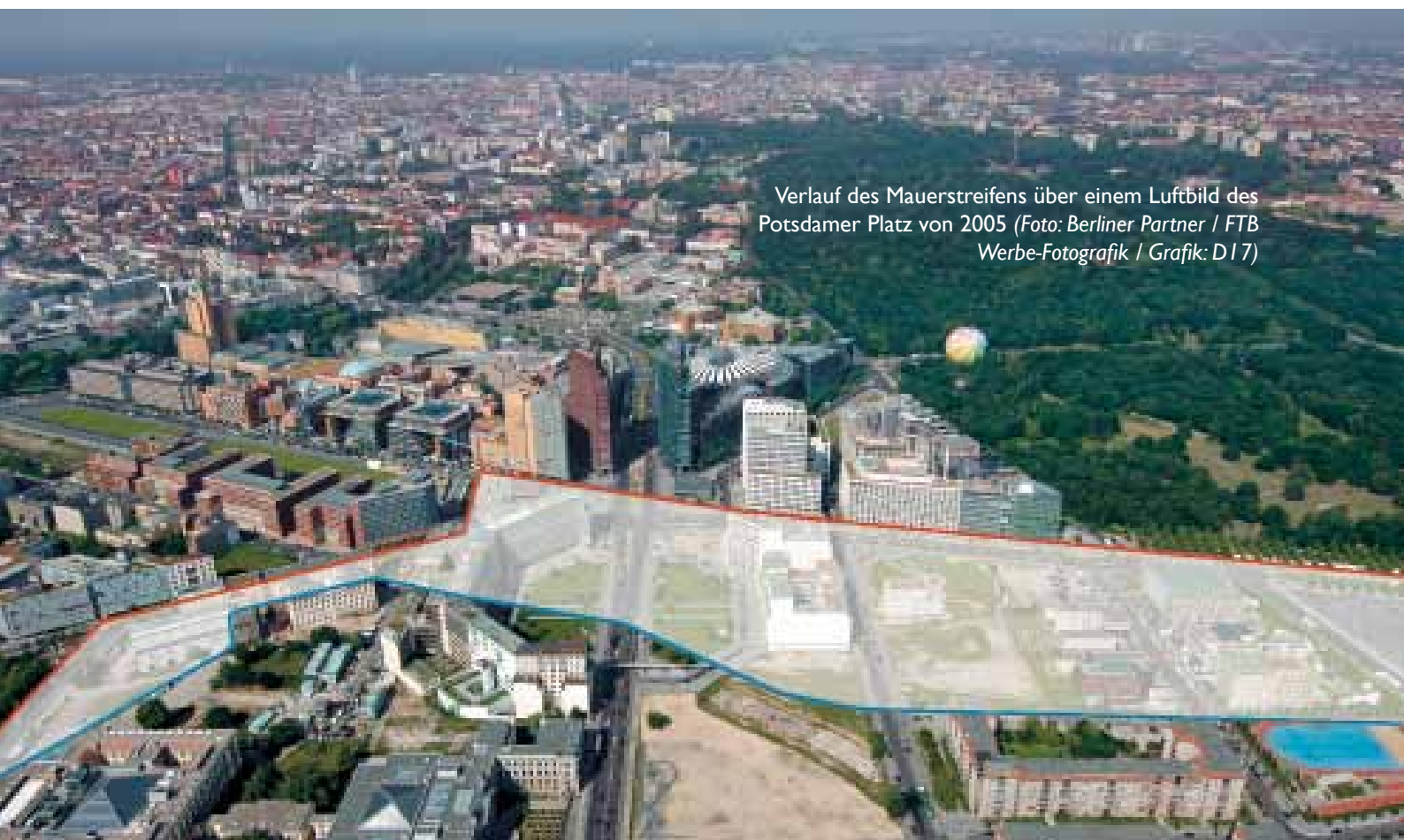
Verlauf des Mauerstreifens über einem Luftbild des Potsdamer Platz von 2005 (Grafik: D17)

In der Folgezeit wurden immer mehr Übergänge zwi-