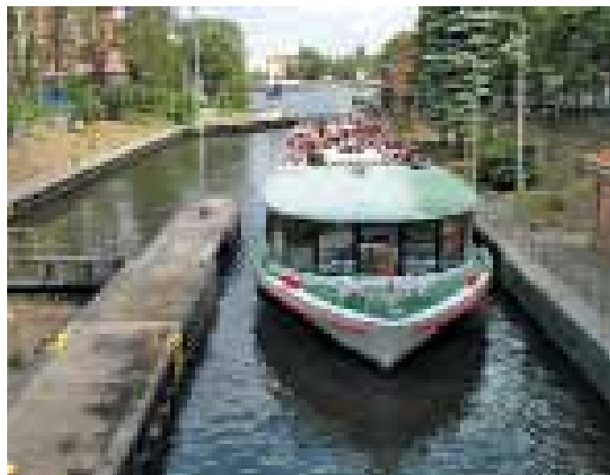
Schleuse zwischen Landwehrkanal und Spree

Den Schiffen auf der Spree jedoch müssen damals sinnbildlich gesprochen nicht nur Steine, sondern wahre Gesteinsmassen vom Herzen gefallen sein, so groß muss ihre Erleichterung nach der Eröffnung des Kanals gewesen sein. Im frühen 19. Jahrhundert reichte nämlich die Transportkapazität der Spree schon lange nicht mehr aus. Insbesondere die Mühlendamm-Schleuse, die schon mitten in der Stadt lag, war den Anforderungen längst nicht mehr gewachsen. Die Schleusenkammern waren für die immer größer werdenden Schiffe und den gewachsenen Ansturm zu schmal und zu kurz. Chaos