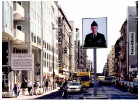
Touristenziel Checkpoint Charlie

In Berlin öffneten sich U-Bahnhöfe, die Jahrzehnte zugemauert waren.