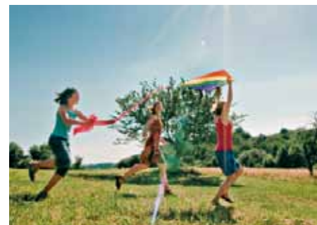
Kinderfüße sollen toben

In der Bevölkerung herrscht ein zunehmender Bewegungsmangel. Dies gilt insbesondere für Kinder: Eine wachsende Zahl bewegt sich nicht mehr ausreichend, wächst vor Spielekonsolen auf, statt gemeinschaftlichen Sportaktivitäten nachzugehen. Kontinuierliche Bewegung und frühstmögliche Vorsorgeuntersuchungen sind wichtig, um bleibende Schäden und drohende Erkrankungen zu vermeiden. Allzu häufig lässt sich feststellen, dass