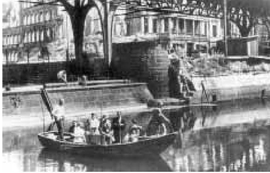
Fährbetrieb auf dem Landwehrkanal an der zerstörten Möckernbrücke 1945

Seine Hauptfunktion als Transportweg für Lastschiffe verlor der Landwehrkanal nach den großen Trümmerbeseitigungen infolge des Zweiten Weltkriegs. Inzwischen wird er fast ausschließlich von Sportbooten und Ausflugsschiffen genutzt. Seine Uferbefestigungen samt Treppen und Geländern stehen seit einigen Jahren unter Denkmalschutz. Auch eine berühmte Gedenkstätte befindet sich an seinem Ufer. Dort, wo sich der Kanal und der Große Tiergarten treffen, wurde nach der Ermordung Rosa Luxemburgs im Januar 1919 an ebendieser