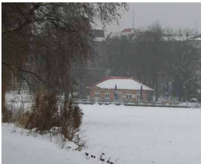
Winter im Lietzenseepark in Charlottenburg

Die richtige Kleidung tragen: Gerade Senioren sollten bei winterlichem Wetter auf rutschfestes Schuhwerk und wasser- und winddichte Kleidung achten. Aus