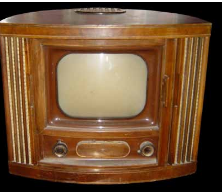
Der V52 Fernseher von Blaupunkt aus dem Jahr 1953

Fernsehen ist für die große Mehrheit der Menschen des 21. Jahrhunderts eine tägliche Normalität. Auf simplen Knopfdruck erscheinen auf den kleinen und großen Bildschirmen der Welt bewegliche Bilder rund um die Uhr. Ob Nachrichten, Wettervorhersage, Börsenstände, Sportübertragungen, Spielfilme, Dokumentar- und Tiersendungen – das Fernsehen als Informations- und Unterhaltungsmedium ist eine einzige Erfolgsgeschichte. Neuen Untersuchungen zufolge sehen die Menschen im Durchschnitt weltweit mittlerweile 232 Minuten pro Tag fern, also knapp vier Stunden. Auch wenn nicht jede einzelne Minute davon tatsächlich auf den Bildschirm geschaut wird, so ist die Zahl doch ein Ausdruck für die hohe Akzeptanz des Mediums.