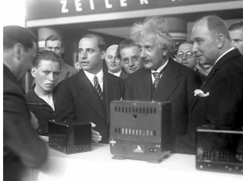
Links: Manfred von Ardenne im Jahr 1934 mit einer Braunschen Röhre / Rechts: Physiker Albert Einstein eröffnet die 7. Funkausstellung (IFA) 1930 in Berlin, erstmals wird ein Fernseher gezeigt.

serielle elektronische Bildübertragungen nicht möglich – ein Irrtum, wie sich Jahre später herausstellen sollte.