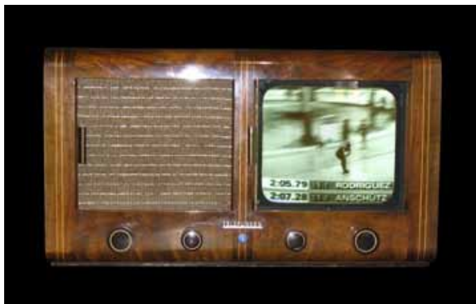
Fernseher von Telefunken aus dem Jahr 1939

Übertragungen einfacher Bilder über mehrere Kilometer mit Hilfe von mechanischen Bildzerlegern waren schon in den 20er Jahren in den USA sowie in Großbritannien erfolgt. Doch erst der Weihnachtstag des Jahres 1930 brachte dann die endgültige Gewissheit, dass auch elektronisches Fernsehen keine Illusion ist. In seinem