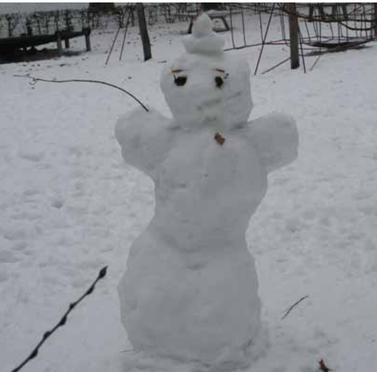
Wird der Schneemann täglich grüßen?

Aber auch für die älteren Menschen stellt eine verschneite Winterlandschaft mit viel Eis und Schnee eine Herausforderung da. Zwar konnten einige im vergangenen Jahr der sozialen Isolation durch das Internet entgehen, aber immer noch ist ein Großteil der Bevölkerung über 60 nicht online. Netzwerke wie Facebook, Myspace oder Xing sind für diese genauso fremd wie die Suchmaschinen Google oder Yahoo. Ob kurzfristig eine Computergruppe für Silversurfer hilft? Senioren