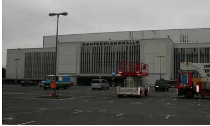
Deutschlandhalle am 29.11.2010