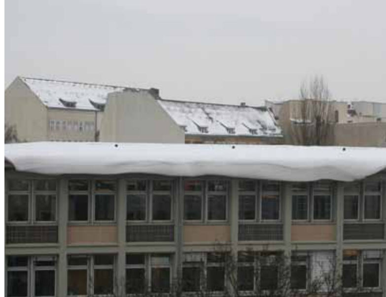
Drohende Dachlawine im Winter 2009 / 2010 am Arbeitsamt in der Müllerstraße im Wedding

Finnland stammt ein Gleitschutz, der mit Hilfe eines Klettbandes am Absatz der Schuhe angebracht werden kann, und so die Sicherheit beim Laufen erhöht. Helle Kleidung stellt zudem sicher, dass man auch bei Dunkelheit gut sichtbar bleibt. Bei Spaziergängen an frostigen Tagen sollte ein dicker Schal vor Mund und Nase getragen werden. So wird die kalte Luft angewärmt und dringt nicht direkt in den Rachenraum ein. Durch die eingeatmete kalte Luft kann es zu einer Verengung der Gefäße kommen, die das Herz versorgen. Gerade Menschen mit Herzerkrankungen oder Bronchialerkrankungen können so schnell unter Atemnot leiden.