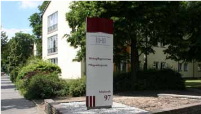
Das Wohnpflegezentrum im Wedding

„Die Menschen möchten auch und gerade im Alter, bei Pflegebedürftig-