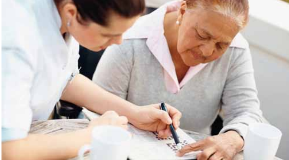
Fit bleiben - Denksport hilft bei Demenz

Es kommt zu gefährlichen Situationen. Die Herdplatte wird angeschaltet, dann aber das Kochen vergessen. Aus Versehen wird Reinigungsmittel getrunken. Essen und Trinken wird vergessen. Falsche Kleidung, etwa der Bademantel auf der Straße oder aber nicht gewechselte verdreckte Kleidung, sind noch harmlos zu Ausziehen in Gesellschaft oder Beschimpfung von wildfremden Leuten, die vor allem für Angehörige ein peinliches Verhalten sind. Überhaupt stellt die Körperpflege ein Problem dar, bei der aber zumeist fremde Hilfe abgelehnt wird. Auch der Tag-Nacht-Rhythmus ist gestört, so wird am Tag geschlafen und nachts umher gewandert. Treten einige dieser Symptome auf, sollte der Betroffene sich von einem Arzt untersuchen lassen und Hilfe in Anspruch nehmen.