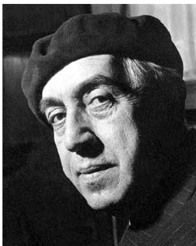
Ernst Reuter

rigen kommunistischen Sowjetunion zu überlassen. „Ihr Völker der Welt, ihr Völker in Amerika, in England, in Frankreich, in Italien. Schaut auf diese Stadt und erkennt, dass ihr diese Stadt und dieses Volk nicht preisgeben dürft und nicht preisgeben könnt.“