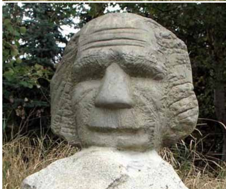
Taka von Asri Sayrac, Purzeln von Helmut Machhammer, Einstein von einem unbekanntem Künstler (von oben nach unten, Fotos: Berliner Forsten)

Anfahrt: Von Berlin fahren Sie mit der S-Bahn Linie S 2 Richtung Bernau zum Bahnhof Buch. Von dort gelangen Sie zu Fuß oder mit dem Rad über die Wiltbergstraße und die Hobrechtsfelder Chaussee zu den Riesefeldern Buch. Die Strecke wird auch von der BVG bedient (Bus 252 Buchholz West, Ausstieg Pölnitzweg). Mit dem Auto fahren Sie via Prenzlauer Promenade und der anschließenden A 114 (Ausfahrt Berlin-Buch) nach Berlin-Buch und von dort über die Hobrechtsfelder Chaussee zu den angegebenen Ausgangspunkten Ihrer Wanderung.