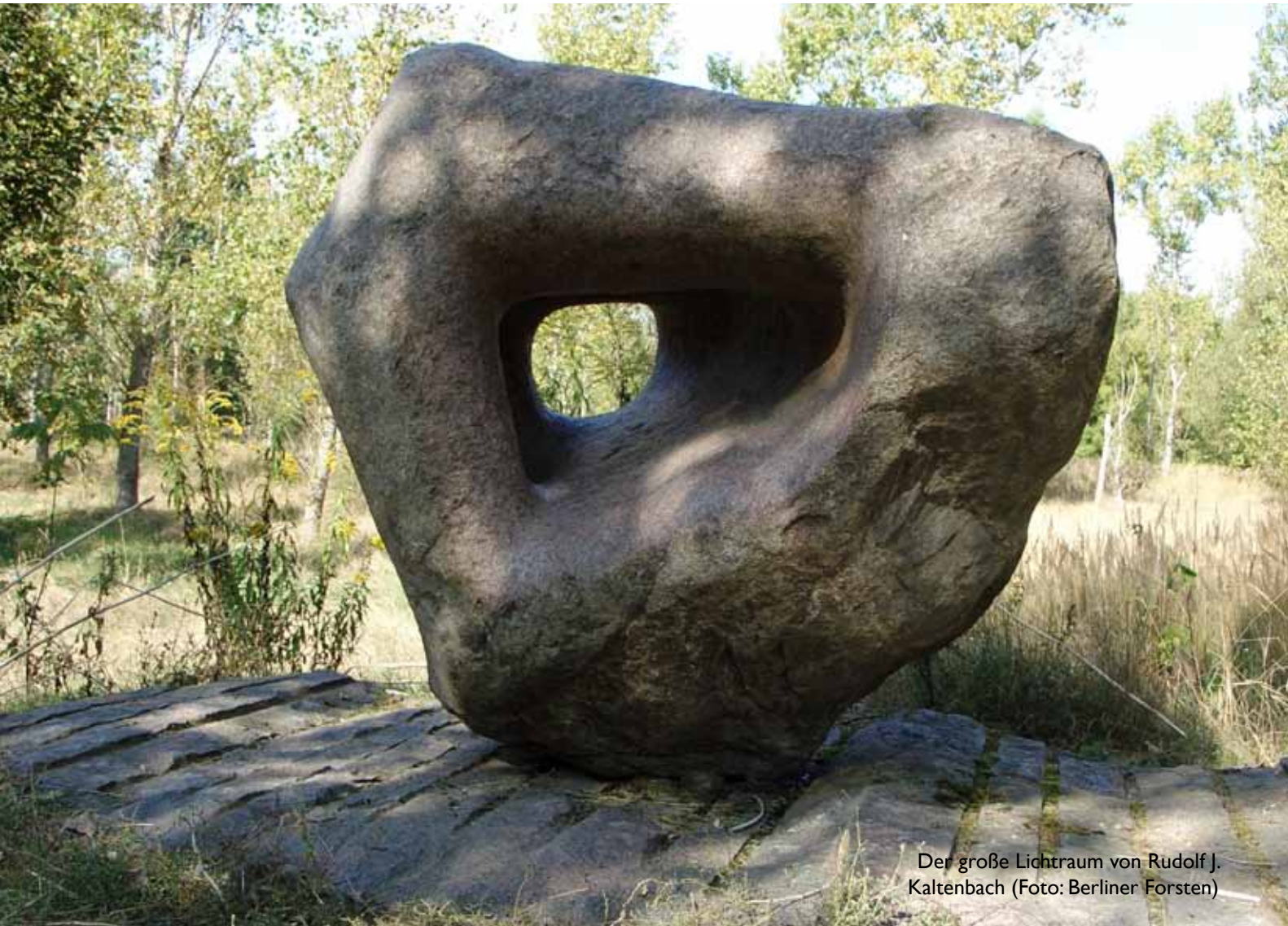
Der große Lichtraum von Rudolf J. Kaltenbach

Im Bucher Forst im Nordosten der Stadt erleben Besucher Natur und Kunst zugleich