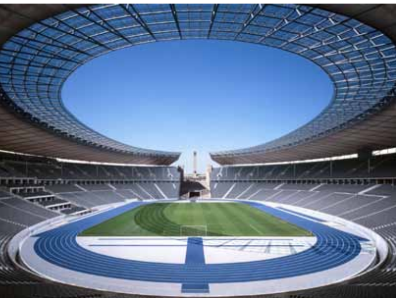
Laufbahn in Hertha blau - Olympia Stadion heute

Budapest, Rom, Barcelona oder Berlin – die Delegierten des Internationalen Olympischen Komitees (IOC) mussten am 13. Mai 1931 im schweizerischen Lausanne eine Entscheidung fällen, in welcher dieser Metropolen die Olympischen Sommerspiele 1936 stattfinden sollten.