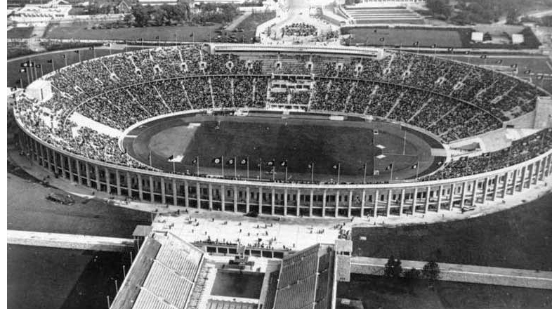
Olympia 1936: Eröffnungsfeier mit Einzug von Adolf Hitler (links), Luftaufnahme des Stadions in Berlin (rechts)

gen war der Ausbruch des Ersten Weltkriegs gefallen, der schließlich zur Absage dieser Olympischen Spiele führte. Doch die Arbeiten für das „Deutsche Stadion“ auf dem heutigen Berliner Olympiagelände im nördlichen Grunewald hatten im Jahr 1912 bereits begonnen. Das Stadion mit all seinen Anlagen wurde im Mai 1913 nach unfassbar kurzer Bauzeit von nur 200 Tagen fertig gestellt. Es entwickelte sich rasch zum Zentrum des deutschen Leistungssports. Als gegen Ende der 20er