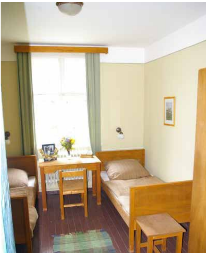
Zimmer von Jesse Owens im Olympischen Dorf

Beginn der Weltwirtschaftskrise die Verwirklichung. Gebaut wurde das Olympiastadion schließlich von 1934 bis 1936 nach umgearbeiteten Plänen von Werner March mit einem Fassungsvermögen von 100.000 Zuschauern. Das Deutsche Stadion war zuvor abgerissen worden. Das Berliner Olympiastadion ist Teil des auf großen Sichtachsen aufgebauten Olympiaparks (früherer Name: „Reichssportfeld“). Zum Olympiagelände gehören auch das Sportforum, das Hockeystadion, das Reitstadion, das Schwimmstadion, die Waldbühne, das Maifeld und der Glockenturm.