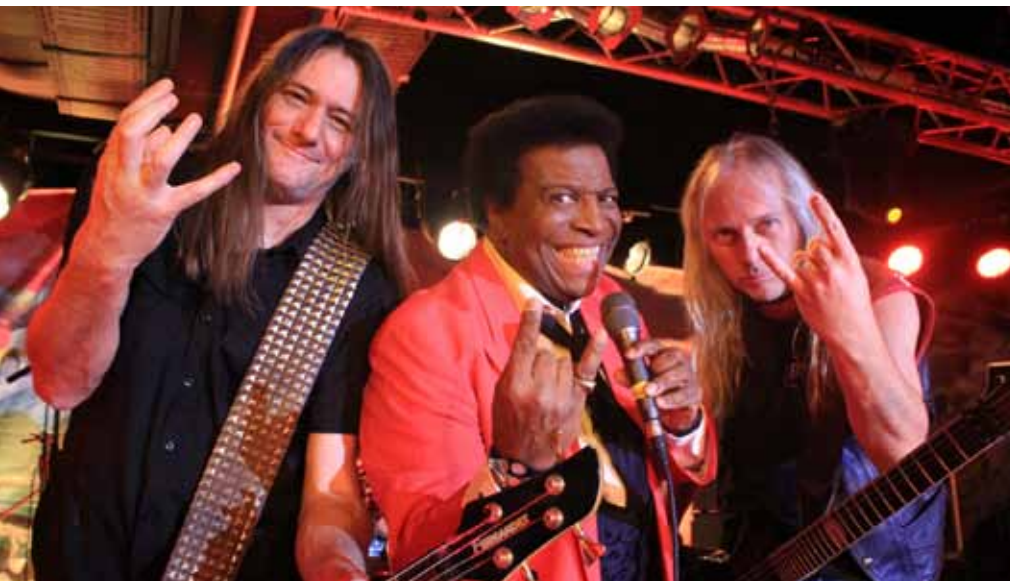
Roberto Blanco und Sodom rocken gemeinsam für einen Spot der Deutsche Alzheimer Gesellschaft e.V.

Mit einem neuen Werbespot macht die Deutsche Alzheimer Gesellschaft e.V. auf die Problematik Demenz aufmerksam. Hauptdarsteller sind Schlagerstar Roberto Blanco und die Heavy Metal Band Sodom. Der 73-Jährige, der mit dem Song „Ein bisschen Spaß muss sein“ 1972 seinen größten Erfolg feierte, war von der Idee sofort begeistert.