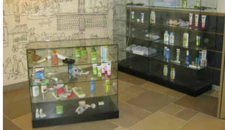
Seniorenspielplatz, von den Enkeln genutzt (links), Drogerie für Wahlfreiheit von Heimbewohnern (rechts)

Anstrengungen, die auch durch das neue Berliner Wohnteilhabegesetz (WTG) aufgegriffen werden. Im Juni 2010 löste es das bisherige Heimgesetz ab. Im Mittelpunkt steht die Selbstbestimmung über das eigene Leben, so heißt es über den Zweck in §1: „Zweck dieses Gesetzes ist es, ältere, pflegebedürftige oder behinderte volljährige Menschen in betreuten gemeinschaftlichen Wohnformen vor Beeinträchtigungen zu schützen und sie dabei zu unterstützen, ihre Interessen und Bedürfnisse durchzusetzen.“