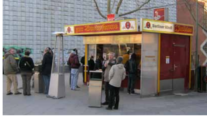
Imbissstraditionen in Berlin: seit 1960 „Konnopke“ unter der Hochbahn in Prenzlauer Berg und seit 1949 „Zur Bratpfanne“ in Steglitz - nach der Currywurst wird in der ganzen Stadt angestanden