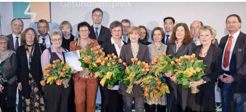
Verleihung des Berliner Gesundheitspreis 2010 am 14. Februar 2011, als Gast Bundesgesundheitsminister Philipp Rösler

Da die Pflege im häuslichen Umfeld Vorrang vor der Einweisung in ein Heim hat, müsse man mehr für die pflegenden Angehörigen tun, versprach Rösler im Rahmen des „Pflegedialogs“. Doch Maßnahmen kosten Geld, und die Frage ist, wie viel Geld für solche Maßnahmen zur Verfügung steht. Diskutiert werden zurzeit vor allem drei Schritte, die allesamt finanzierbar erscheinen. Zum einen könnten für pflegende Angehörige Kuren nach dem Vorbild der Mutter-Kind-Kuren eingeführt werden. Auch sollten die Pflegezeiten von Angehörigen bei der Rente stärker berücksichtigt werden als bisher. Zudem soll der Austausch von pflegenden Familienangehörigen in Selbsthilfegruppen finanziell gefördert werden.