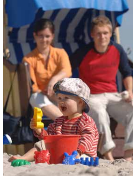
Sonnenhut, Sonnenschutz - Mittagshitze meiden