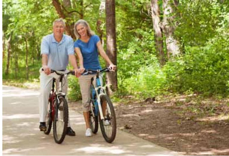
Fit gefördert: Rad fahren

Mit zunehmendem Alter verschiebt sich der Schwerpunkt vom Ausdauer- auf das Krafttraining. Bereits ab dem 30. Lebensjahr kann man pro Lebensjahrzehnt fünf bis zehn Prozent seiner Muskelmasse pro Jahrzehnt verlieren. Im hohen Alter können dies bis zu 50 Prozent werden. Dabei ist Kraft vor allem im Alter wichtig, so verringert ein entsprechendes Training die Sturzgefahr und führt zu einem längeren selbstständigen Leben. Krafttraining ist also ideal, um das Muskelniveau zu halten.