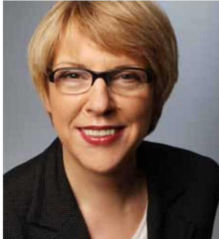
Elisabeth Beikirch bekämpft jetzt die Pflege-Bürokratie

Seit dem 1. Juli soll im Bundesministerium für Gesundheit (BMG) mit Hilfe einer neu eingerichteten Arbeitsstelle die ausufernde Bürokratie in der Pflege eingedämmt werden. Als „Ombudsfrau für Entbürokratisierung in der Pflege“ – so die offizielle Stellenbezeichnung – konnte die unabhängige Pflegeexpertin Elisabeth Beikirch verpflichtet werden. In dieser Funktion wird die Berlinerin die geplante Pflegereform begleiten und ihrerseits Vorschläge für weniger Bürokratie in der Pflege unterbreiten.