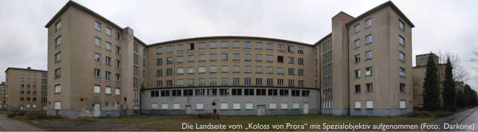
Die Landseite vom „Koloss von Prora“ mit Spezialobjektiv aufgenommen