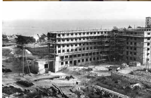
Prora von der Meeresseite (oben), nachgebauter KdF-Raum (mitte), in der Bauphase (unten)