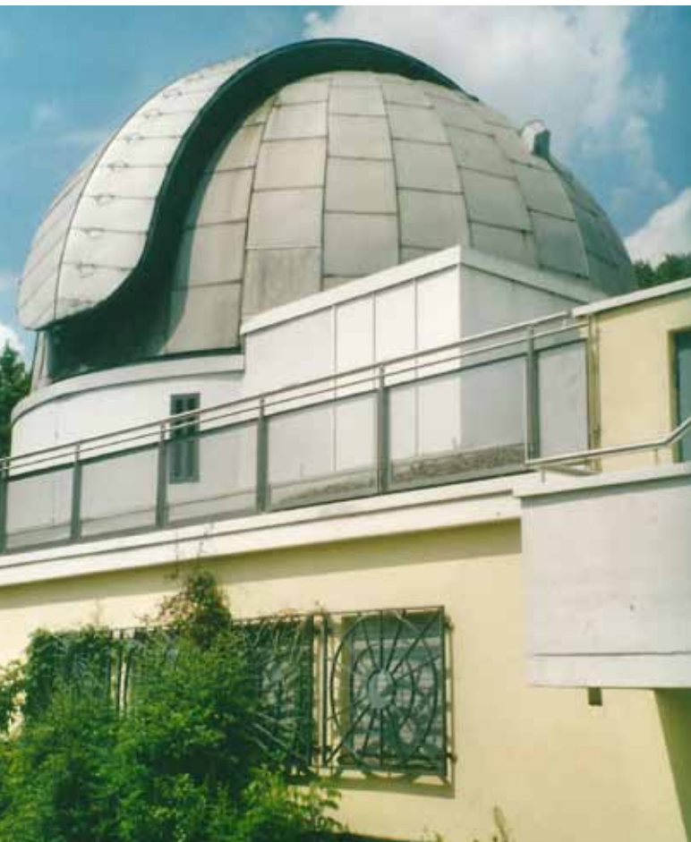
Wilhelm-Foerster-Sternwarte seit 1963 auf dem Insulaner

Berlin ist eine wald- und wasserreiche Stadt inmitten der norddeutschen Tiefebene. Berge gibt es hier weit und breit nicht zu sehen, weder in der Hauptstadt noch im benachbarten Brandenburg. Allenfalls als Hügel oder Anhöhen kann man die Erhebungen bezeichnen, die das Flachland der Tiefebene unterbrechen. Berlins größte natürliche Erhebung ist mit 114,7 Metern über dem Normalhöhennull der Große Müggelberg in Köpenick. Exakt die gleiche Höhe erreicht der Teufelsberg im Grunewald. Diese Anhöhe in der Nähe des Teufelssees ist allerdings künstlich, da er aus Trümmern besteht, Bruchstücke von Gebäuden, die im Zweiten Weltkrieg zerstört wurden.