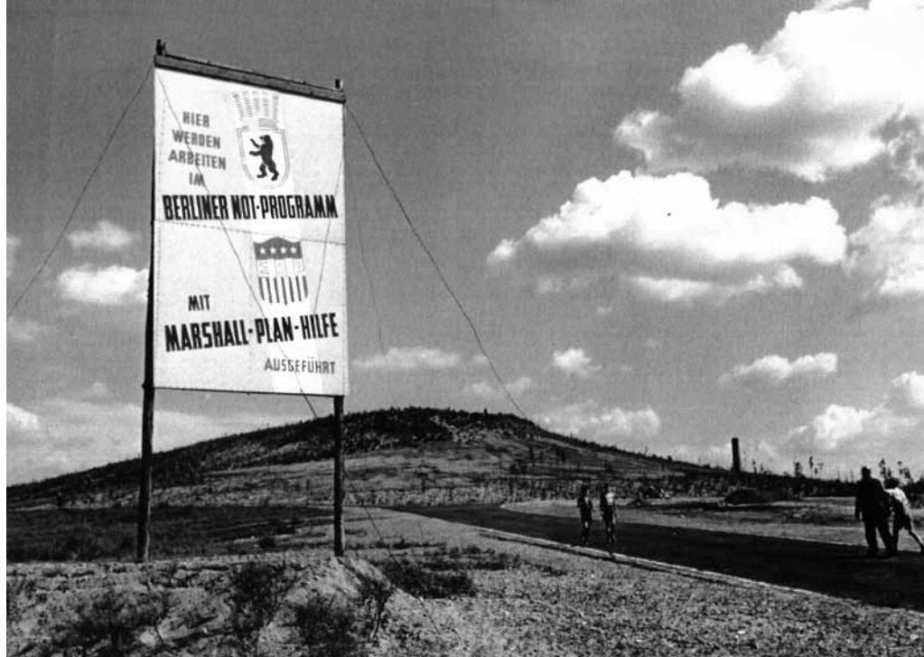
Ein neuer Berg ist gewachsen, der Insulaner 1951 (Foto: Heimatverein Steglitz e.V.)

Im Jahr 1965 kam das Planetarium am Fuß des Insulaners hinzu. Was die Sternenforscher freut, ist für Spaziergänger allerdings ein Nachteil. All diejenigen, die in der Hoffnung auf den Insulaner steigen, einen schönen Rundblick auf Berlin zu erhalten, müssen enttäuscht werden. Der Trümmerberg ist komplett zugewachsen. Durch die dichten Sträucher und Gebüsche kann man selbst das benachbarte „Sommerbad am Insulaner“ kaum sehen. | Michael von Finckenstein