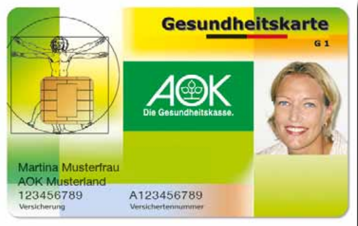
Muster der Gesundheitskarte

borbefunde und Informationen über die Einnahme von Medikamenten. Patientenverfügungen und Organspendeerklärungen wären eine weitere sinnvolle Eingabe. In einer letzten Ausbaustufe, die allerdings noch einige Jahre dauern könnte, soll der elektronische Arztbrief installiert werden, mit dessen Hilfe Ärzte verschiedener Fachrichtungen untereinander, aber auch mit Kranken-