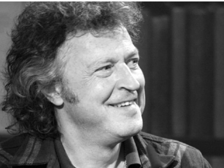
BAP-Sänger Wolfgang Niedecken

Beim Schlaganfall kommt es auf Minuten an. Spezielle „Stroke Units“ in Krankenhäuser sind auf die Erkrankung eingerichtet, sollen bevorzugt angefahren werden. Umso schneller die Hilfe ist, umso größer sind die Heilungschancen. Immerhin ist der Schlaganfall inzwi-