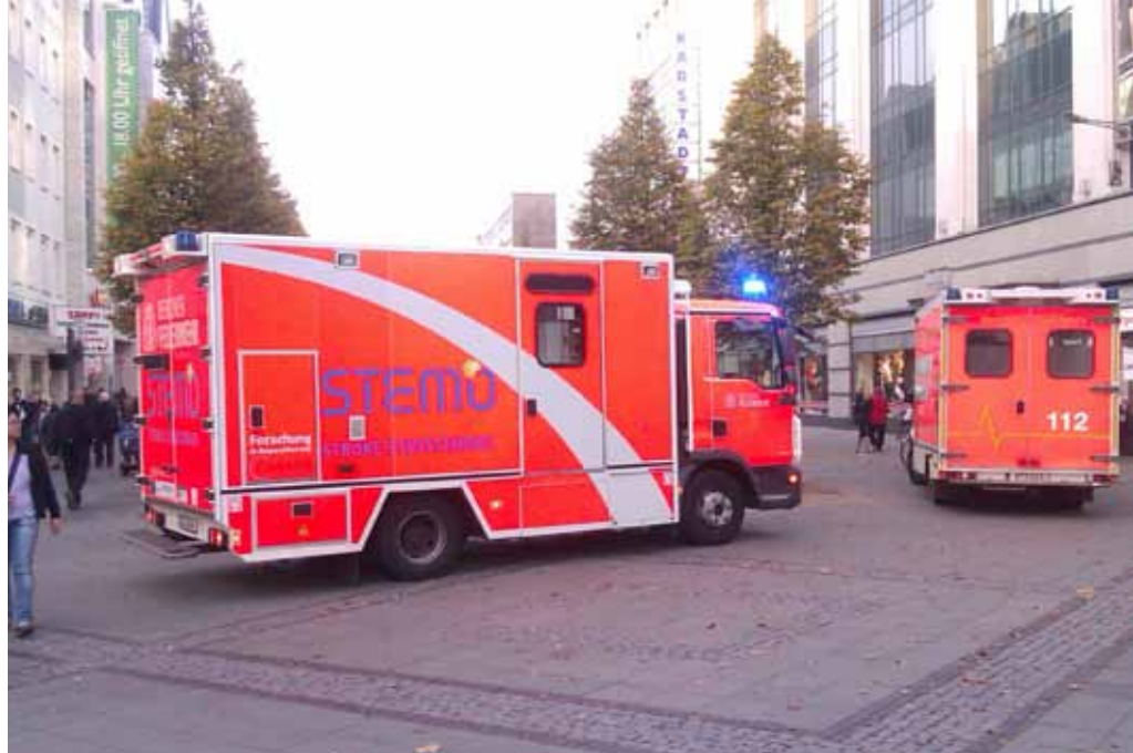
Schlaganfallrettungswagen der Berliner Feuerwehr

Der Schlaganfall selber tritt plötzlich, schlagartig auf. Anzeichen sind die Lähmung oder Taubheit meistens einer ganzen Körperseite, halbseitige Gesichtslähmungen mit daraus folgenden Schwierigkeiten beim Sprechen, Kauen und Schlucken. Der Mund ist dabei häu-